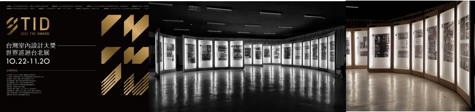
世界巡迴展覽第三站/台北展