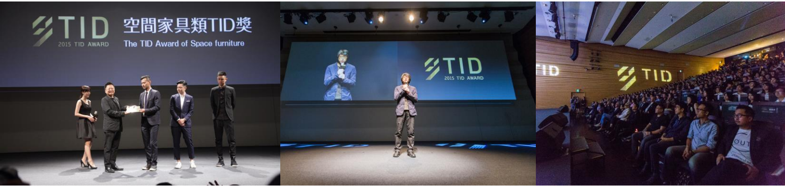
頒獎典禮/誠品表演廳