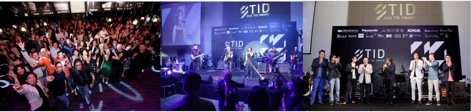
計師之夜/克緹大樓 14 樓