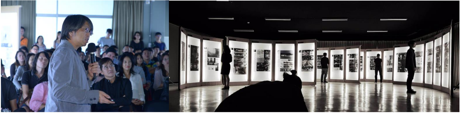
世界巡迴展覽第三站/台北展