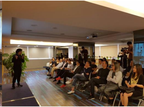
世界巡迴展覽第二站/香港展